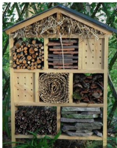
Un Hôtel à insectes