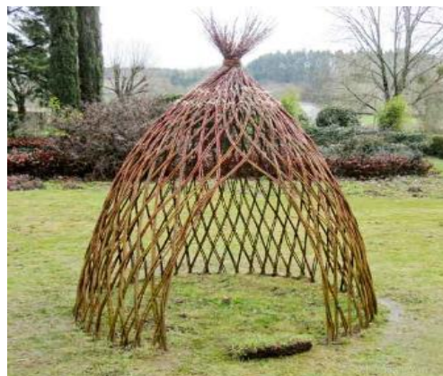
Un jardin où l'on puisse jouer !