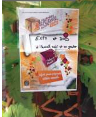
Cocagne Acepp 31