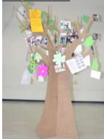
A Petits Pas (64)