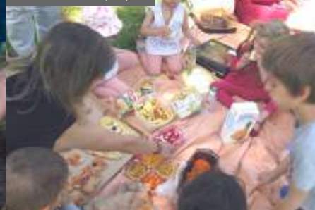
Acepp Rhône (69)