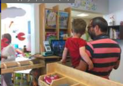
Les Ptits Drôles (38)