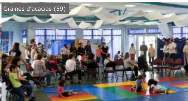
Graines d'acacias (59)