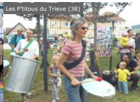
Les P'titous du Triève (38)