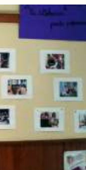
La Sappeyrlipopette (38)

D'où l'intérêt de renforcer notre ancrage dans le réseau des crèches de Colline Aceptp... »