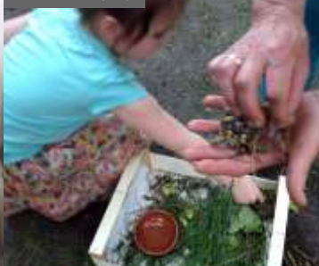
La Balancelle (38)