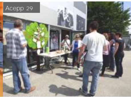
La Sappeyrlipopette (38)