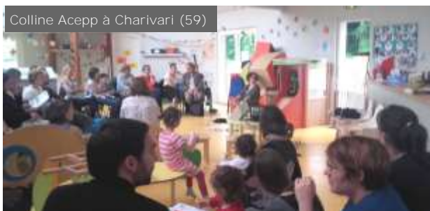
Colline Aceptp à Charivari (59)