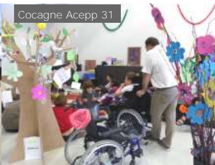
Cocagne Aceptp 31